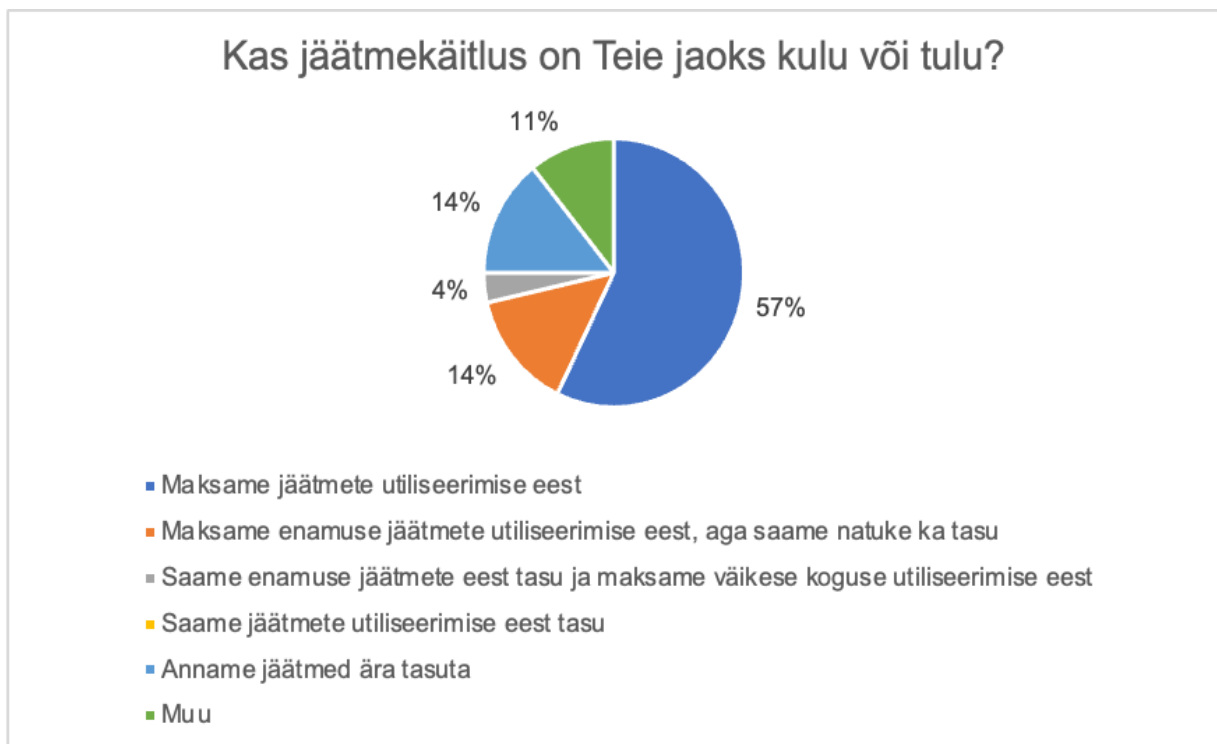
Joonis 3. Kas jäätmekäitlus on ettevõtjate jaoks kulu või tulu

Jäätmekäitlus võib olla ettevõtete nii kulu kui ka tulullikas (joonis 3). Summad mida makstakse jäätmete äraviimise eest varieeruvad. Ühel ettevõttel on väidetav kulu 0€, osadel ettevõtetel 500€, mõnel 4000-7000€. Kõige suurem kulu võib ulatuda kuni 20 000€.