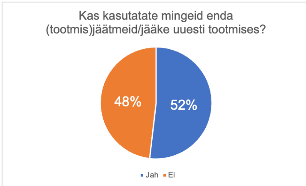
Joonis 4. Tootmisjääkide kasutamine ettevõtete tootmistes

Üks peamisi põhjuseid, miks ettevõtted hetkel oma jääke ei väärinda, peitub võimekuses leida materjalile soovija. Lisaks toodi välja, et see on ajamahukas ettevõtmine ning paljud ei näe oma tootmisjääke väärtuslikena. Mitmetel ettevõtetel oleks valmisolek oma jääke sobivuse korral kas müüa või siis ära anda, kuid seda olenevalt tingimustest. Paljudele oleks üks põhitingimusi see, et transpordi eest vastutab jäätmete ostja/saaja.