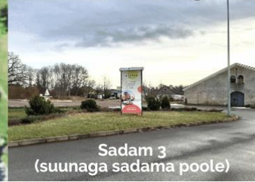
Sadam 3 (suunaga sadama poole)