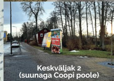
Keskväljak 2 (suunaga Coopi poole)