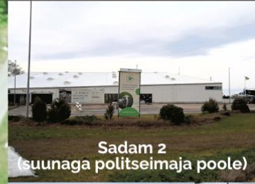
Sadam 2 (suunaga politseimaja poole)