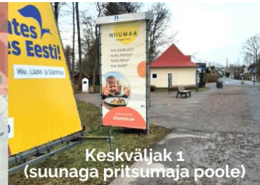
Keskväljak 1 (suunaga pritsumaja poole)