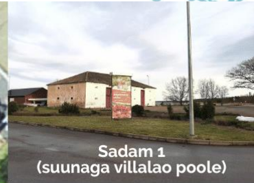
Sadam 1 (suunaga villalao poole)