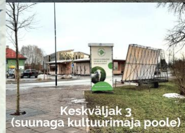
Keskväljak 3 (suunaga kultuurimaja poole)